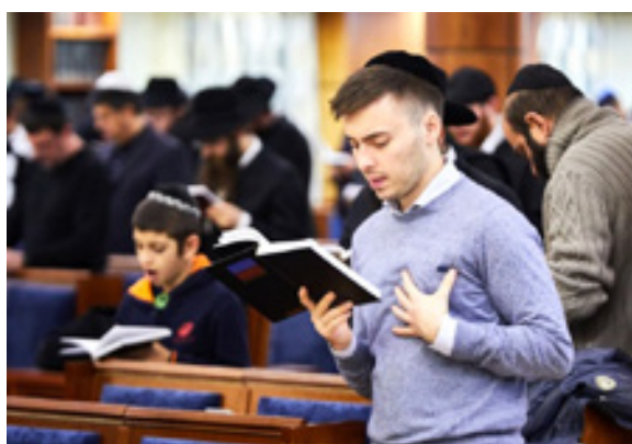
לחשוב על החיים עצמם. אמירת סליחות במוסקוה

ימי הסליחות קוראים לנו לעצור ולעשות את חשבון הנפש האמיתי: כמה תשומת לב אנו נותנים לדברים החשובים באמת, לחיים עצמם?