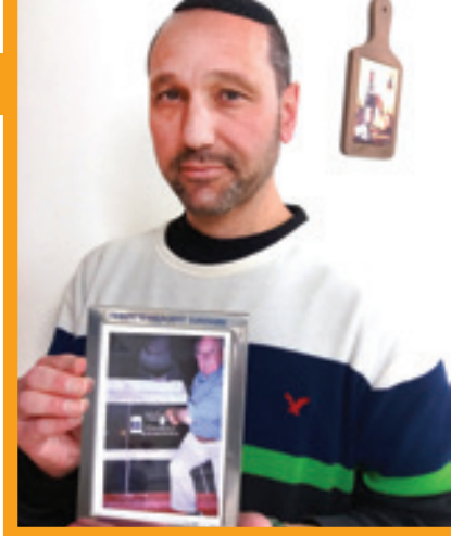
רפי עם תצלום אביו. והקב"ה מצילנו מידם

"אבא הוא היחיד מכל המשפחה ששרד. הוא עבר חוויות קשות וניצל בנסי ניסים. לאחר תקופה במיינדק נשלח לאושוויץ־בירקנאו. לקראת סוף המלחמה, בחורף 1944 למניינם, הכריחו אותו לצעוד בצעדת המוות. בחסדי שמים אבא ניצל. הוא עלה לארץ ישראל והשתתף בקרבות מלחמת השחרור. לפני כחמש שנים הלך לעולמו. אני מאמין שאבא שמר עליי מלמעלה, ואולי גם הגנה עליי זכות השיעור הקבוע שיש לי בספר התניא, בבית חב"ד באפרת."