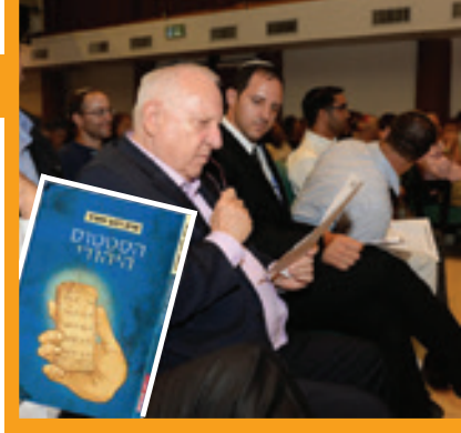
סמל סטטוס. נשיא המדינה בשיעור

מקורות: שו"ע או"ח סי' רצט ס"ו. שו"ע אדה"ז שם ס"ח"ט. מ"ב שם. ש"ש כהלכתה (ח"ב) פנ"ח ס"ט"כ, ושי"ן.