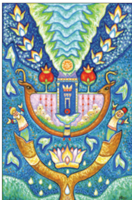
הקב"ה מקבל אותנו באהבה (ציור: ברוך נחשון, חברון)

ראש השנה היהודי שונה תכלית שינוי מתחילת השנה בעמים אחרים. יהודים מתקרבים לראש השנה בחרדת קודש, מתוך היטהרות פנימית וחשבון נפש