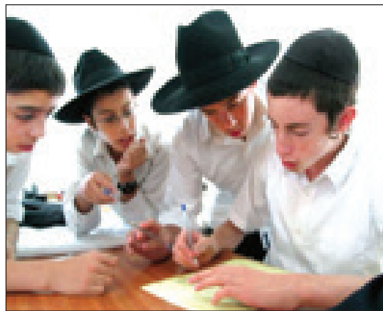
להקשיב למערך השיקולים. תלמידי ישיבה בחופשת הקיץ

איש אינו אוהב פטרונות וכפייה, ובכך כשלה החקיקה שנעשתה בממשלה הקודמת. את הפטרונות צריך לחפש יחד, בכבוד, בהידברות וברגישות