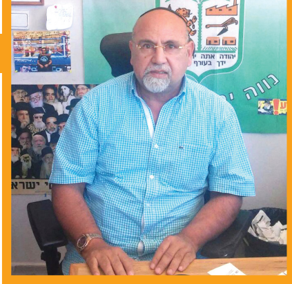
קריאת 'שמע ישראל' עולמית. ממן

רוני מציין שתמיד ראה בעצמו אדם שכלי והיגיוני, ולכן דחה את האמונה הדתית, שנראתה לו נטולת ביסוס. "פתאום הבנתי שדווקא