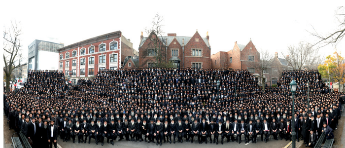
שלוחים שזקנם הלבין ושלוחים צעירים. שינוי מפת העולם היהודי

השלוחים האלה משנים את מפת העולם היהודי. הם נוגעים בליבם של מיליוני יהודים, מלבים את הגחלת ומקרבים אותם לאביהם שבשמים