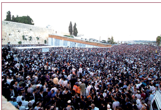
הזעקה: התפילה הענקית ברחבת הכותל המערבי ערב הגירוש

לא היה צורך להיות נביא או בעל גישה למקורות מודיעיניים חסויים כדי להבין שתכנית ה'הינתקות' תמיט עלינו אסון. אבל האוזניים היו אטומות