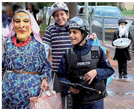
לא להיבהל, זו רק תחפושת

רק לפני כמחצית השנה היינו סמל ומופת לאחדות מופלאה. ימי 'צוק איתן' הביאו לידי ביטוי את כל הטוב והיפה שבעם ישראל. מה קרה?