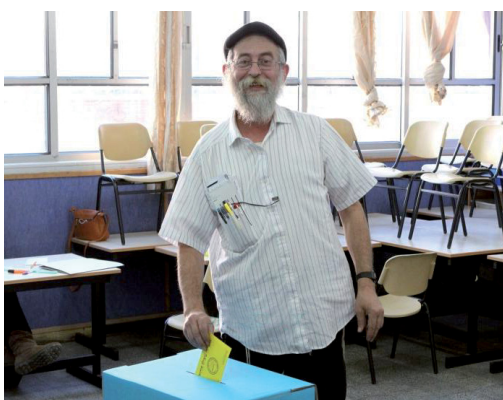
חייבים למנוע אבדן קולות. הקול מכריע

אל תניחו ללהטוטי התעמולה לבלבל אתכם. שאלות כבדות משקל עומדות להכרעה. רק בכוחות מאוחדים נצליח