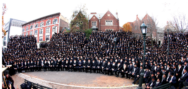
התצלום הקבוצתי. להפעיל את הדמיון

המפגש עם האנשים הללו גורם לך להתפעם מנחישותם להגיע לכל קהילה יהודית, ולו הנידחת ביותר, ולהפיח בה את חיי היהדות