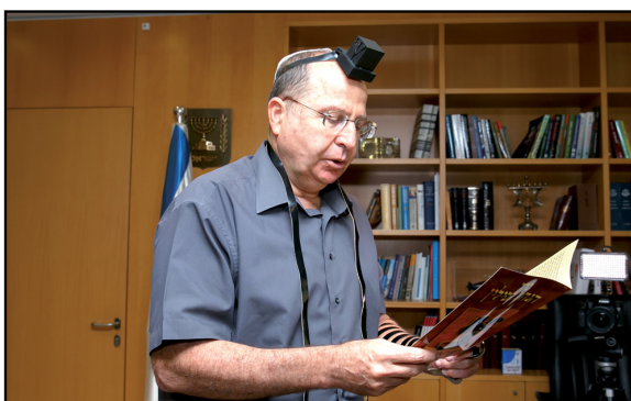
שר הביטחון מניח תפילין בעצם ימי המערכה

החיילים מחרפים את נפשם כדי שהאיום הזה יוסר מעלינו אחת ולתמיד ולא כדי לקנות שקט לעוד שנה-שנתיים