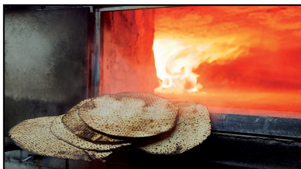
מצות האמונה, שמחדירות אותה לתוך גופנו ונפשנו

ברור שאסור לסמוך על הנס וחובה לפעול בדרכי הטבע, אך יש רגע שאתה יודע כי רק ישועה אלוקית ניסית תחלץ אותנו מהמשבר