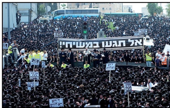
מי מעוניין בהתססת הציבור החרדי?

מדינה יכולה לכפות דברים על הפרט. אין בכוחה לנהוג דורסנות כנגד ציבור גדול, במיוחד בדברים הנוגעים לאמונה ולאורחות חיים