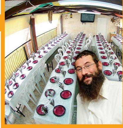
הרב כהן והשולחנות הערוכים

בסידור רב עמרם גאון, ברמב"ם, בטור וברמ"א כתבו, שגם שליח הציבור אומר 'יהא שמיא רבא...! והטעם, מכיוון שהוא קורא לכל הקהל לומר זאת, ודאי שגם עליו לומר זאת איתם, כדי שיהיה בכלל המברכים. עלפי רוב הדעות, לא יאמר 'אמן, מכיוון שכבר אמר 'ואמרנו אמן, והרי