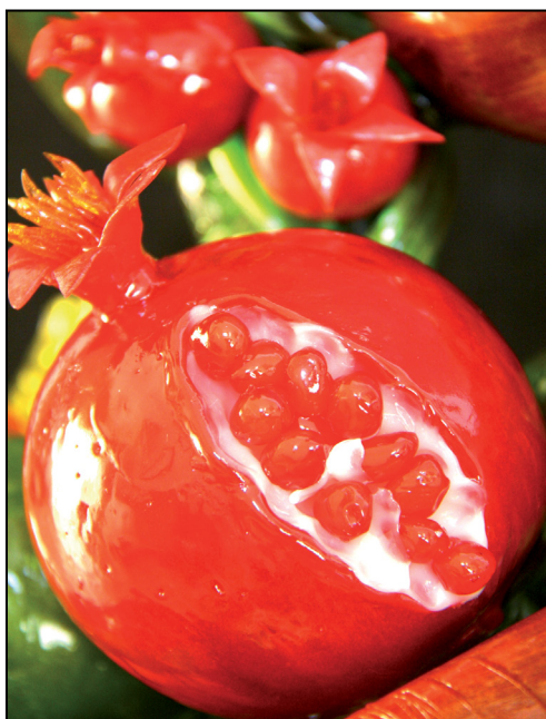
לבקש שנה טובה (צילום: סוכרייה, אמנות ניפוח סוכר)

כל ימות השנה אנו עסוקים בבעיות החיים. נותנים לנו הזדמנות לשנות, לפתוח פתח לתקווה חדשה, לבקש ולקבל שנה טובה יותר