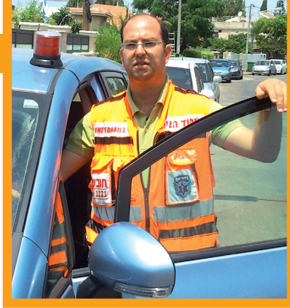
"בהחייאה ראיתי את הוריי לנגד עיניי". חודריאן

על כל אלה מברכים 'מזונות' ואחרי האכילה 'על המחיה'. אולם אם אוכלים כשיעור קביעת סעודה (216 סמ"ק, אם שבעים ממנו), נוטלים ידיים תחילה,