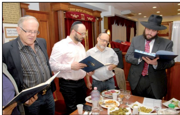
להתחבר אל התורה. סיום מסכת בהונגריה

כל עוד מכנים את תלמידי הישיבות 'בטלנים' ו'משתמטים' זה דו־שיח של חירשים, וכל מה שנותר הוא משחק של כיפופי־ידיים