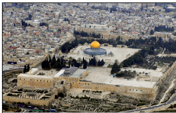
הר הבית, המקום המקודש ביותר לעם ישראל, נתון ביד זרים

אנו מתאבלים בימים האלה לא רק על אירועי העבר, אלא על הגלות העמוקה ועל המציאות המשובשת שאנו שרויים בהן כאן ועכשיו