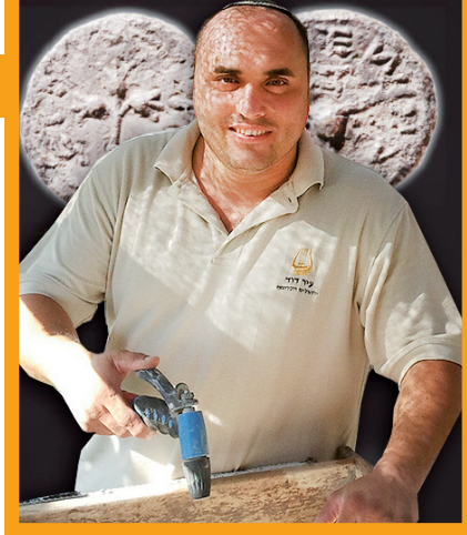
עבר קם לתחייה. אברהמי על רקע מטבעות שנמצאו באתר

מקורות: שו"ע יו"ד שפה ס"א. או"ח תקנד ס"כ ונו"כ. פני ברוך' על אבלות פרק טז.