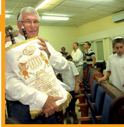
פלד בהכנסת ספר התורה בבית השיטה

עשרות שנים נמשכו החיים עלפי המתווה של דור המייסדים, אבל אטיאט החל להתרחש