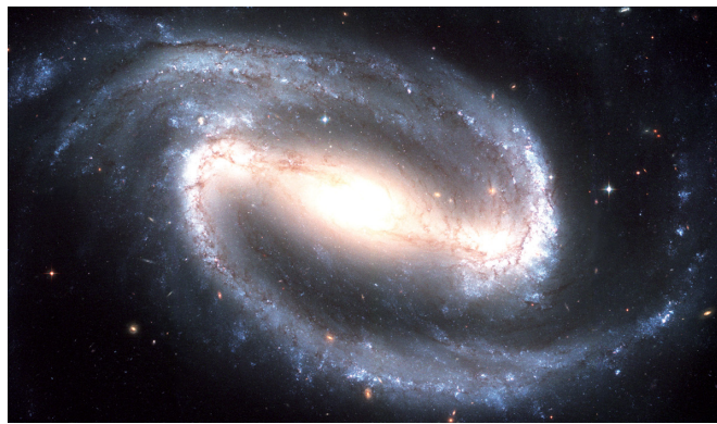
מרחבי הבריאה. גלקסיה לולינית

פרשת בראשית יש לה חשיבות אדירה, שכן היא מציבה את יסודות המוסר. כאן נקבעים עקרונות המותר והאסור ומושגי הטוב והרע