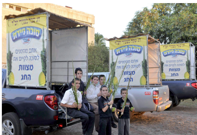
האחדות היהודית היא ממאפייני חג הסוכות

הסוכה מבטאת את חסדי הבורא ואת העובדה שאנחנו חוסים בצילו ובוטחים בו. חג הסוכות מעניק כוח להבאת יציבות ושלוש לכל העמים