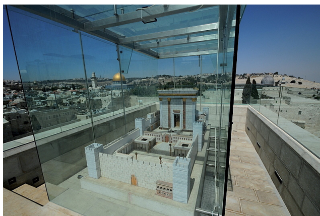
דגם בית-המקדש השלישי מול הר הבית. כיסופים ותקווה

בעיצומם של ימי קיץ בהירים, כשהעולם כולו יוצא לנפוש ולבלות, היהדות באה ומזכירה שאנחנו בגלות, אבלים וכואבים על חורבן בית-מקדשנו