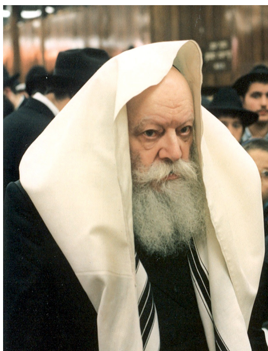
הרבי מליובאוויטש. התמסרות ללא שיוור למען עם ישראל

הרבי מליובאוויטש הוא קרון האור ששתל הקב"ה דווקא בדור היתום והמוכה שלנו, דור רב תהפוכות, מבוכות ולבטים