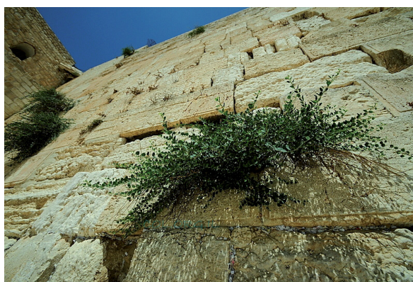
גל התעוררות שטף את הלבבות לנוכח אבני הכותל

היו ימים: כתבים ביטאו את פרץ רגשותיהם נוכח אבני הכותל, קבר רחל ומערת המכפלה. לא עלה על הדעת לתת בימה לתעמולת האוייב