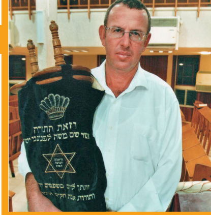
זיסק וספר התורה שנתגלה מחדש

מוצר שיש ספק אם יש בו תערובת חמץ, או יש ספק אם זה חמץ שעבר עליו הפסח, או שיש ספק