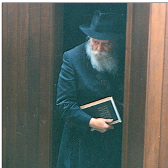
הרבי מליובאוויטש ונידו ספר 'משנה תורה' לרמב"ם. כל התורה

דמו בנפשכם יהודים שאימצו את תקנת 'הרמב"ם היומי' מיד עם היווסדה. הם סיימו עכשיו בפעם השלושים את כל התורה כולה!