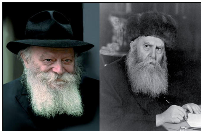
הרבי הרי"צ מליובאוויטש וחתנו וממלא מקומו, הרבי מליובאוויטש. הכנה לגאולה

מסר מרגיע לרבים החוששים מפני גאולה שבאה מתוך תהפוכות נוראות ומלחמות. הרבי קבע שהכול יתנהל בחסד וברחמים