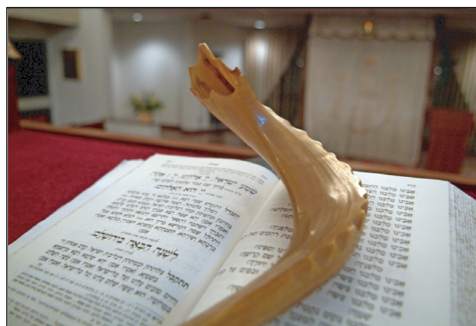
שנה חדשה, תקוות חדשות, החלטות חדשות.

יום הכיפורים מפנה קריאה אל כל יהודי - אל תעצור, אל תדרוך במקום, אל תתייאש. הקב"ה מושיט אלינו יד, ואנו נקראים לאחוז בה