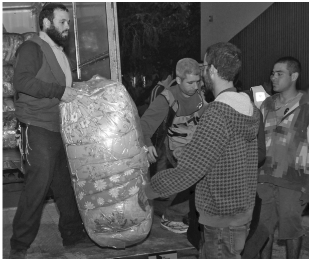
מתנדבים בחלוקת שמיכות לנזקקים.

לא דיי לקיים את מצוות הצדקה והחסד משום שזו מצווה. הקיום השלם של המצווה הוא כשהאדם חש אכפתיות לזולת ודאגה אמיתית לשלומה