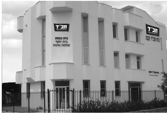
המיתוג החדש. הדמיה על בית חב"ד ביבנה

למה תנועה חסידית, שמשתתפה הרעיונית נוגעת בדברים העמוקים והפנימיים ביותר בנפש האדם ובעבודת הבורא, עוסקת בענייני מיתוג