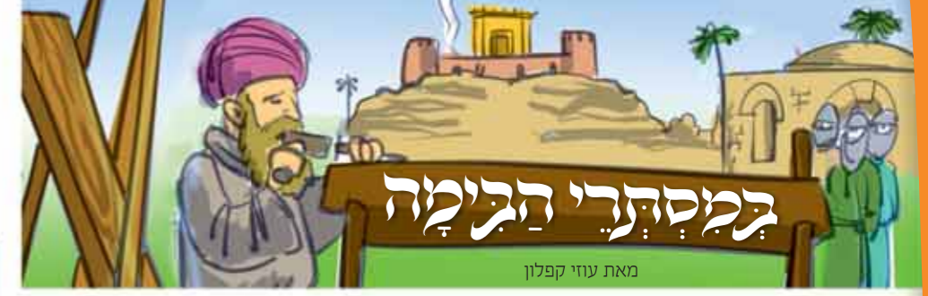
מאת עוזי קפלון

תקציר: בכמה אסירים בסיביר, תחת המשטר הסובייטי, קבוצת יהודים נתפסת בקהל הדלקת נר ראשון של חגכה. פנהיג החבורה, פרדכי, מוכא לבישופט, ושופע שפענשו פנות, על כי "אותת לאובי" באפצעות האורות הקטנים... השופט מבקש להשאיר עם פרדכי לבדו, ומגלה כי גם הוא יהודי.