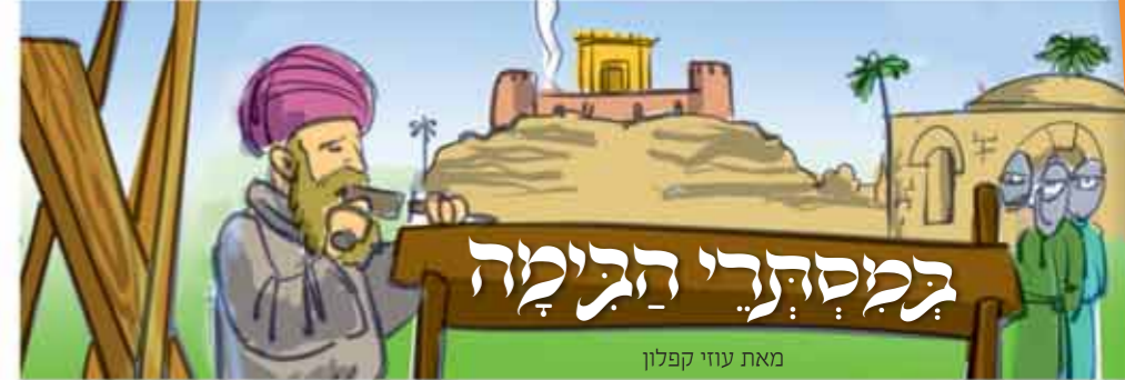
מאת עוזי קפלון

תקציר: בפתח אסירים בסיביר, תחת הפיקוח הסובייטי, קבוצת יהודים נערכת לחג החגכה..