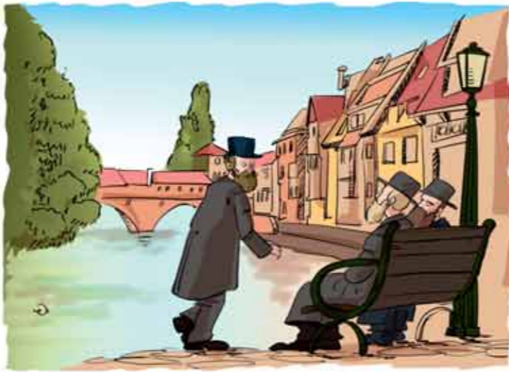
(על-פי סיפורו של הרב גרינולד לתכנית 'תורת חיים' של JEM)

מקפיד. בהיותך רב ופוסק הלכה, אני מבקשת ממך לדבר אתו ולומר לו שהדבר מתר, ושעליו לגשת לרופא שנים ולשים קץ לסבלו'.