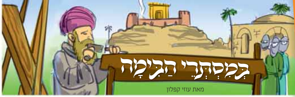
מאת עוזי קפלון

תקציר: באשר היה רבי לוי יצחק פּוֹדְוֵצ'ק אגודת צעירי, לאחר שנים בהן היה סוחר על שלחן חותנו, עמד החותן על כך שרבי לוי יצחק ימשיך גם בן בתו הפסוקה. לשם כך שלח אותו ליריד בלוצ'א עם צרור פסוק גדול ובלוי שני סוחרים. בלוצ'א, ישב רבי לוי יצחק (עם צרור הפסוק) בבית הפסוקה, בעוד השנים סבבו בשוק. אך אוה, התברר שהפסוק נעלם. השלושה חזרו אל החותן שגרש בכעס רב את רבי לוי יצחק מפניו.