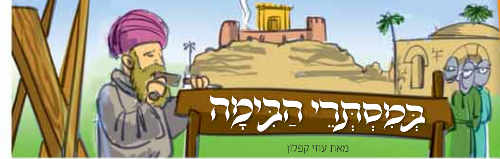
מאת עוזי קפלון