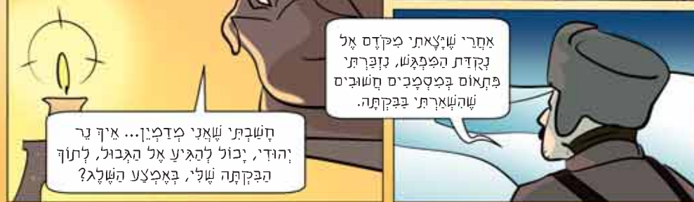
א לשמור על קדושת הגיליון

עריכה: ד. גרוזמן ניקוד ועיצוב: פרלשטיין אירויס: רפי דרוק משתתפים: מ"מ הרשקוביץ, עוזי קפלון לחומנות: 073-2480711 יוצא לאור על-ידי: המרכז לעזרי שליחות ת"ד 100 כפר חב"ד 6084000 • טל' 03-3731777 • פקס' 03-960169 www.chabad.org.il • chabad@chabad.org.il