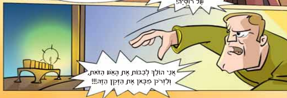
א לשמור על קדושת הגיליון