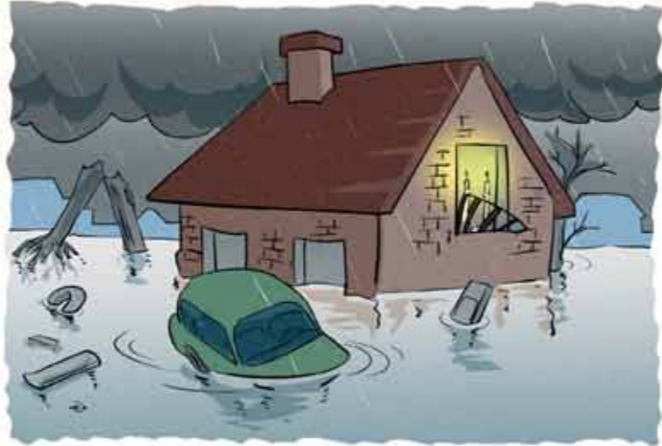
(עיבוד מהספר 'אברהם אבינו של אוסטרליה', מאת ר' אורי פולון)

בלתי-מובנת תפסה הידיעה את התענינותה והיא לא הצליחה להסיח את דעתה ממנה. בתוך כך החלו לעלות גם זכרונות ומחשבות שלא נתנו לה מנוח.