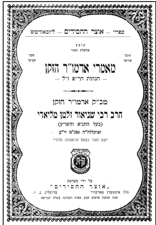
שער ספר המאמרים 'הנחות הר"פ'