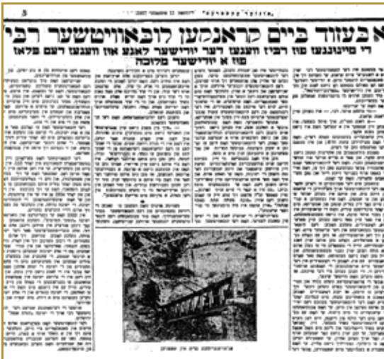
תצלום הראיון הנדיר בעיתון 'מאָרגן זשורנאל'