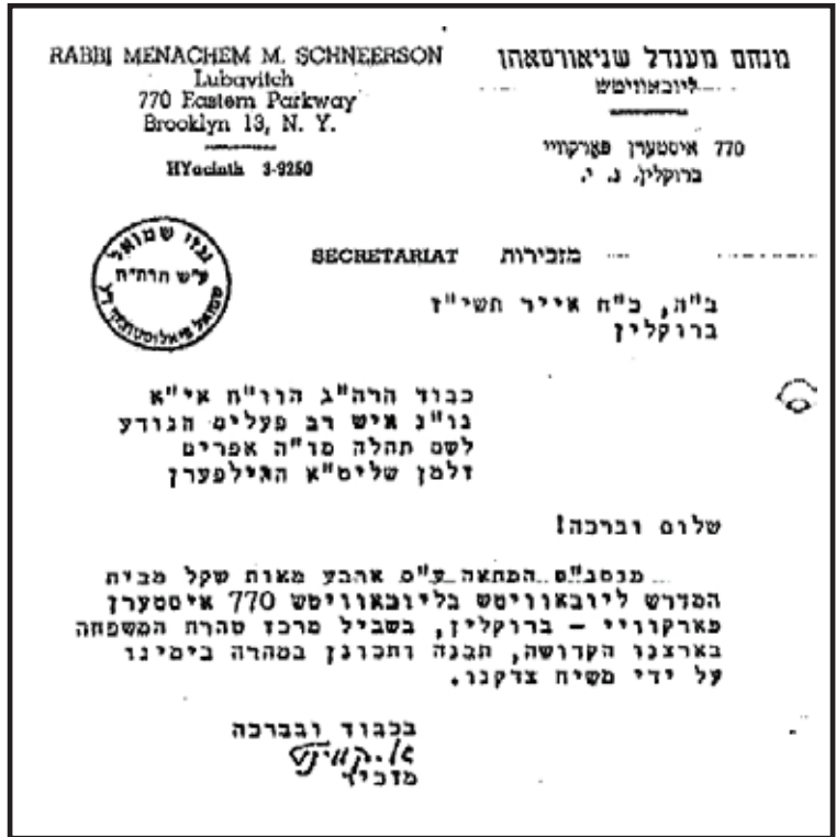
מכתב מזכירות הרבי שצורף להמחאה ע"ס 400 שקל - דמי ה'מגבית' שנאספה

"וזכות מצוה גדולה זו תכן עליכם להתברך ממקור הברכות בשפע ברכה והצלחה בכל מעשה ידיכם. ותזכו להוסיף חיל בפעולותיכם החשובות בכלל ובפרט להפיץ המעינות חוצה להגדיל תורה ולהאדירה, ויה"ר שנוכה במהרה לראות בהרמת