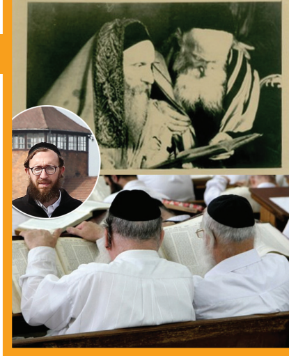
החיים היהודיים אז והיום. עזרא והתערוכה

לפי זה, גבאי שנבחר על-ידי הציבור, אינו חייב למסור לו דוח, אלא אם כן מינו אותו בתנאי שיגיש לציבור חשבון אחת לשנה וכדומה. ואולם כדי שיהיה "נקי מה" ומישראל" ראוי לו שייתן תמונה כללית: כמה הכנסות הגיעו ומניין, ולאלו מטרת הוצא הכסף.