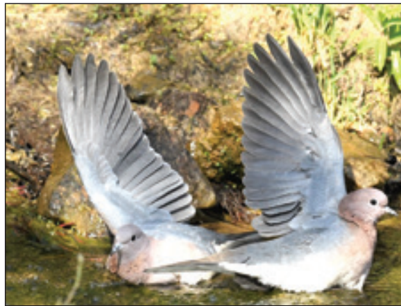
עת לקריאת התחדשות

השגרה, ככל שתהיה טובה ונעימה, מביאה עמה גם שחיקה ואבדן החדווה. ההתחדשות מפיחה בחיינו רוח חדשה ונוסכת בנו מרץ ושמחה.