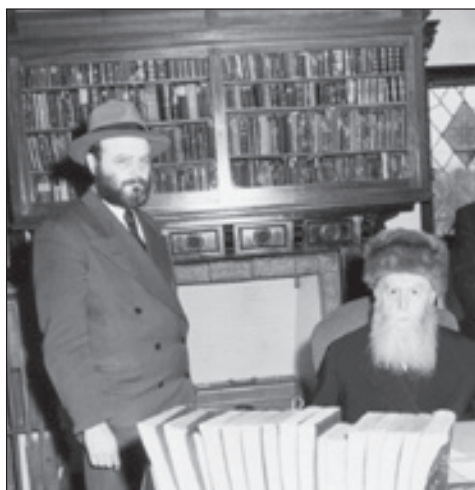
המהפכנים. הרבי הרי"צ וחתנו וממלא מקומו, הרבי מליובאוויטש

מנהיגי ישראל שהטמיעו את תחושת האחריות לעם ישראל ואת החשיבה במושגים של כלל ישראל. זה הזמן לאמץ ולהפנים